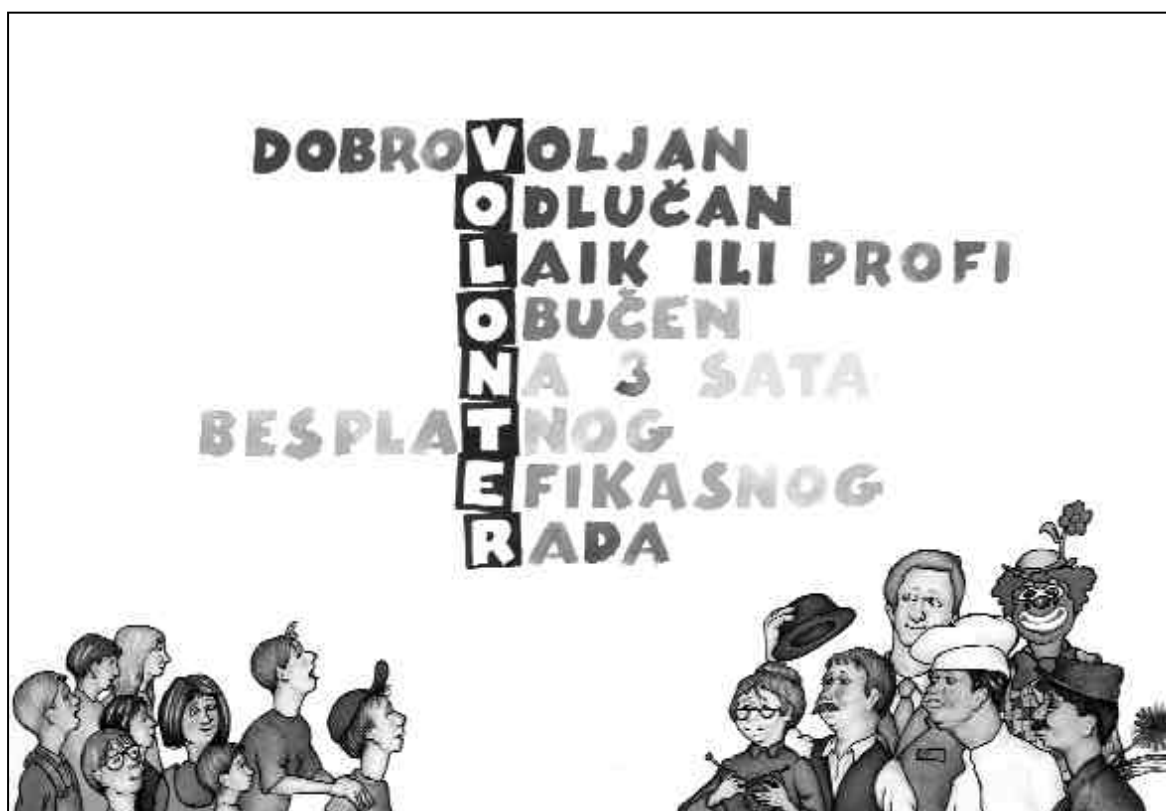
Nikola Petkov, plakat kampanje „Budi volonter” - „VelikiMali”

Koliko daleko su otišle druge zemlje u procesu deinstitucionalizacije pogledajte na strani 44.