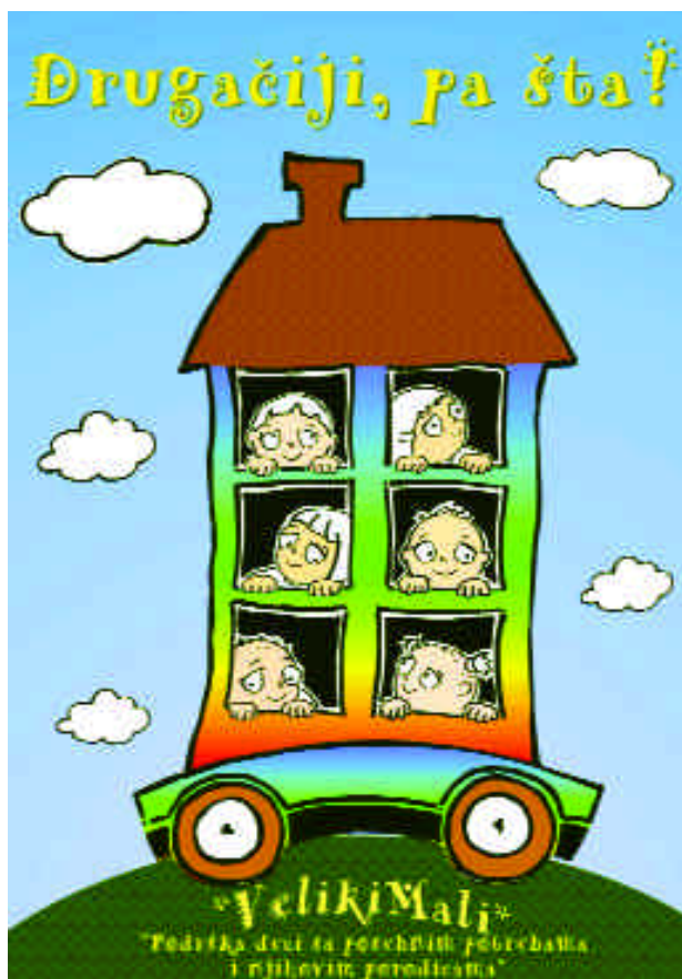
Maja Veselinović, idejno rešenje za plakat u okviru kampanje „VelikiMali” - „Drugačiji, pa šta!”

Iz Konvencije o pravima deteta napravili smo izbor članova ili njihovih delova koji, po našem mišljenju, zavređuju da budu posebno istaknuti zbog svog značaja za decu sa smetnjama u razvoju. Čitajući ovaj priručnik, u svakom poglavlju moći ćete da se upoznate sa nekim od odabranih članova, koji će, radi lakšeg prepoznavanja, biti uokvireni i istaknuti ružičastom bojom.